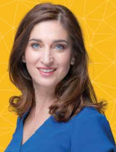
Zuahl Demir Vlaams minister van Justitie en Handhaving, Omgeving, Energie en Toerisme

“De N-VA blijft kiezen voor een betaalbaar, betrouwbaar en duurzaam energiebeleid. Dat maakt ons onafhankelijk van schurkenregimes. ”