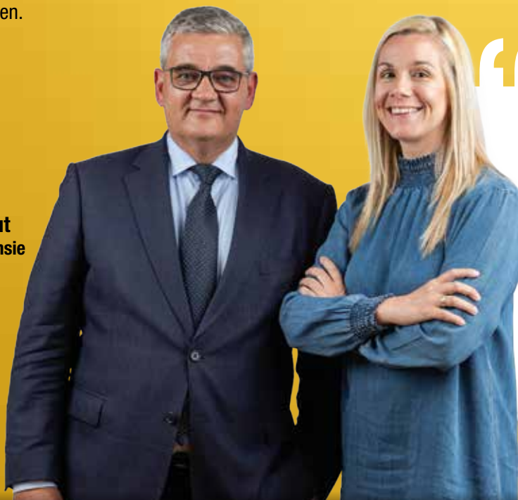
Steven Vandeput Minister van Defensie Lijstduwer

3 De N-VA ziet Limburg en de Limburgers graag! We denken na over een nieuwe manier van besturen in onze provincie, gebaseerd op structurele samenwerking tussen gemeenten. Het Limburggevoel mag niet om opportunistische redenen misbruikt worden.